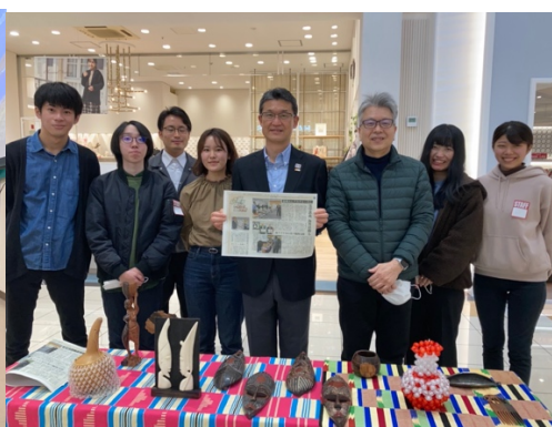
図9：宮崎大学でトゴ一行・ゼミ生交流会