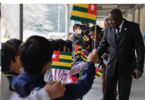
図2：東郷学園小学校での国際交流