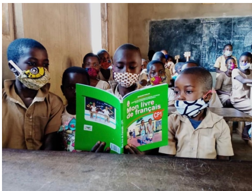
図7：ケボジグベ小学校図書寄贈事業