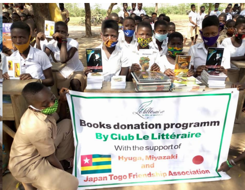
図8：ガメリリ中学校図書寄贈事業