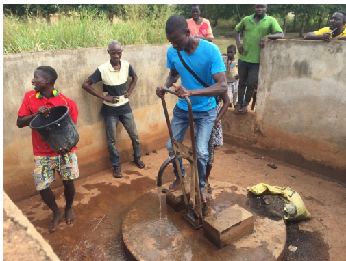
図5：アティテコペ村井戸修復事業

支援は、RI2730地区の地区補助金を活用した、宮崎アカデミーRCの単独事業として2021年に計画している。現地協力団体は、リテラル、ロメパールRC。