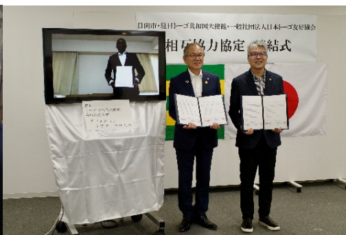
図4：相互協力協定締結式での調印