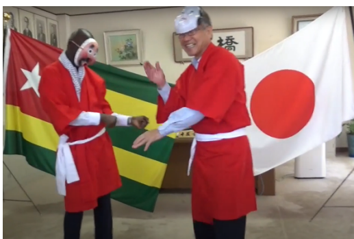
図1：ひょっとこ踊りによる交流

本協定を契機に、日向市は日本トーゴ友好協会の賛助会員となり、3年間にわたり日本トーゴ友好協会に寄付し、トーゴ共和国における国際協力活動を支援する。このように相互協力協定を締結されたことで、日向市・トーゴ大使館・日本トーゴ友好協会の連携が強化され、日向市はホストタウン受け入れ地方自治体としては珍しく国際協力事業のフェーズに入った。