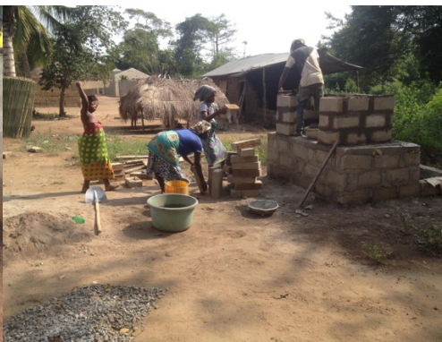
図6：アティテコペ村トイレ建設事業